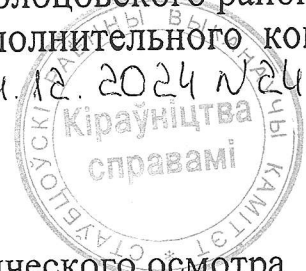
ГРАФИК проведения государственного технического осмотра зерноуборочных комбайнов и их допуска к участию в дорожном движении в 2025 году по Столбцовскому району

УТВЕРЖДЕНО Решение Столбцовского районного исполнительного комитета 24.12.2024 №2464