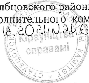
ГРАФИК проведения государственного технического осмотра кормоуборочных комбайнов и их допуска к участию в дорожном движении в 2025 году по Столбцовскому району

УТВЕРЖДЕНО Решение Столбцовского районного исполнительного комитета 24.12.2024 № 2464